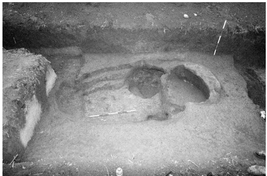
Слика 2 - Средњовековна калотаста пећ Figure 2 - Medieval kiln