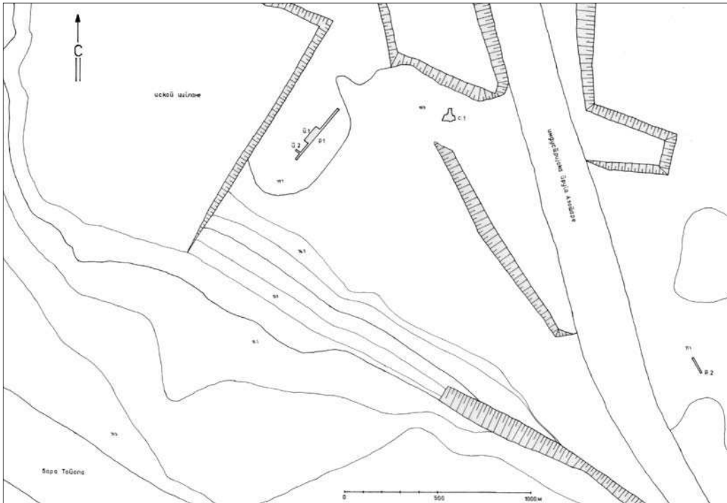
Слика 1 - Деталј ситуационог плана локалитета Доњоварошка циглана Figure 1 - Detail of the plan of the site Donjovaroška ciglana

Trench 1 (35 m long, 1 m wide) confirmed the complex stratigraphic situation of the site. Medieval cultural