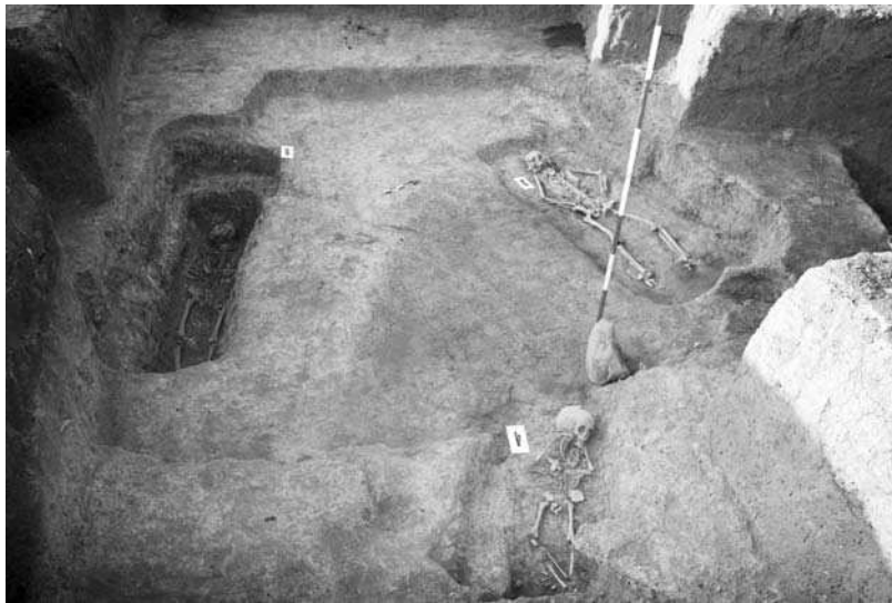
Слика 3 - Средњовековна кућа и део позно-средњовековне некрополе Figure 3 - Medieval house and part of the late medieval necropolis

Stratigraphic situation in the test pit matches the complexity recorded in trench 1. A relatively small excavated area (19 m 2 ) yielded remains of: a Late Medieval necropolis, a medieval house, a Late Classical dugout, a prehistoric layer with parts of a dwelling structure, probably a freestanding one. The dugout foundation of the medieval house can be traced to the relative depth of 0.8 m. It is shallowly (up to 0.3 m) dug into the prehistoric layer, trapezoidal in plan